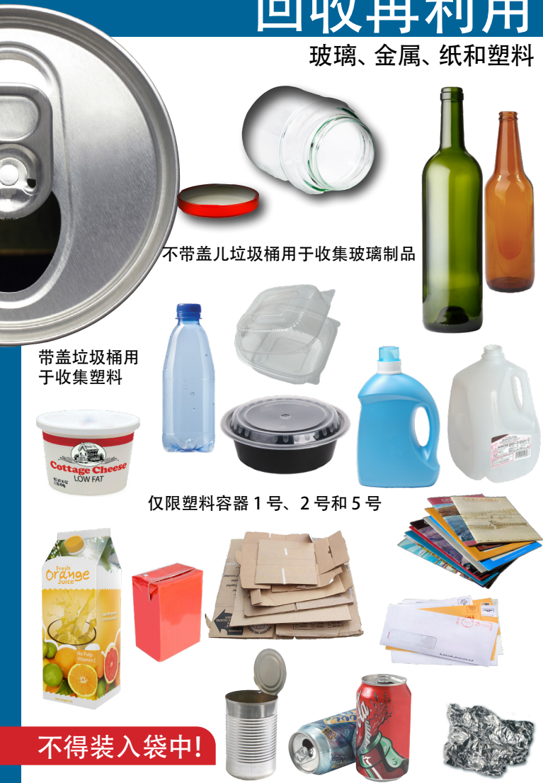
不带盖儿垃圾桶用于收集玻璃制品